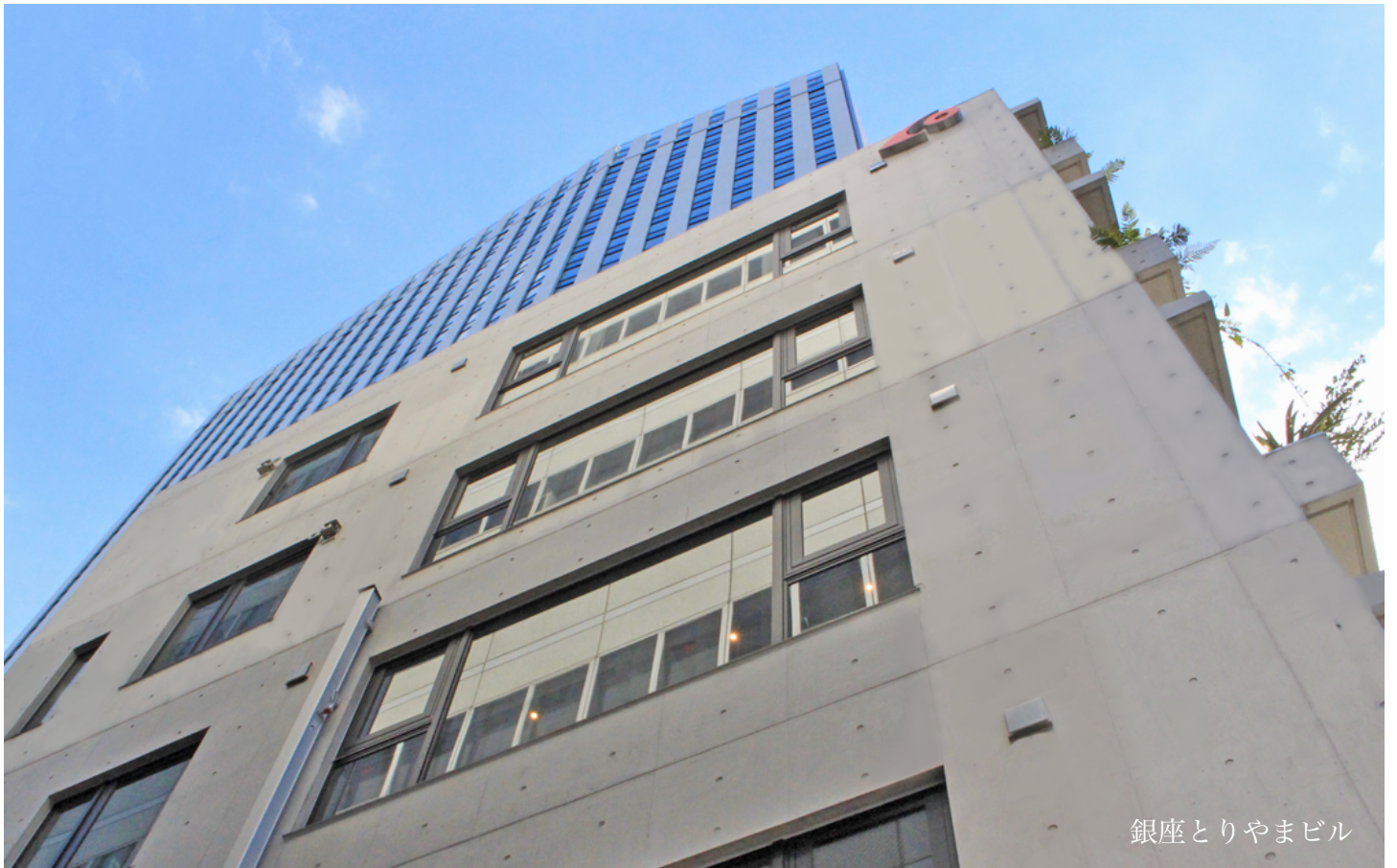
銀座とりやまビル

安い・早い・正確に・相談しやすい ワンストップサービスで幅広い業務に対応 一生つき合い運命共同体を目指します 土日営業中、相続・不動産に強い 税金は合法的に1円でも安くします